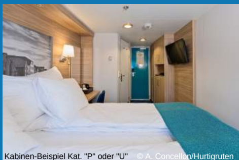
Kabinen-Beispiel Kat. "P" oder "U"

Unsere MS Nordnorge wurde 2016 komplett renoviert und verfügt über eine moderne und arktisch inspirierte Inneneinrichtung. Während der gesamten Reise begleitet Sie Ihr Radio 8 Reiseleiter und gleichzeitig freuen wir uns über ein Hurtigruten Expeditionsteam an Bord. Die Experten werden uns mit interessanten Vorträgen versorgen. An Deck können Sie zusätzlich an Informationsveranstaltungen teilnehmen, auf denen Sie mehr über die Natur, Kultur und Phänomene erfahren, die es auf der Reise zu entdecken gibt. Darüber hinaus können Sie mit dem Expeditionsteam an „Friluftsliv“-Aktivitäten und Wanderungen entlang der Küste teilnehmen. An Bord befinden sich übrigens drei Restaurants, die schiffseigene Bäckerei und Eiscreme-Bar „Multe“, eine Sauna und ein Fitnessraum. Genießen Sie an Deck in einem der beiden Whirlpools die fantastische Aussicht oder nehmen Sie in der gemütlichen Bar im Vorderteil des Schiffes ein traditionelles Getränk zu sich. Im großen Bereich „Kompass“ befinden sich Rezeption, Reiseleitung, Konferenzraum und der Shop. Das obere Deck bietet einen herrlichen Blick auf die eindrucksvolle Naturlandschaft – egal, ob Sie die Sonnenterrasse, das Aussichtsdeck oder die Panorama-Lounge wählen.